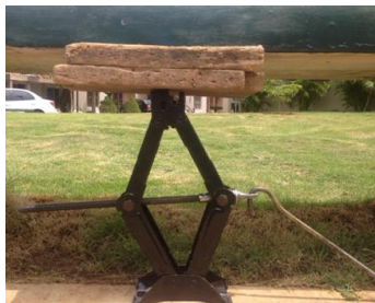
Fig. 1. Prensa artesanal mecánica usada para la extracción del aceite del neem.

Los cotiledones ("almendras") obtenidos (20 g) se colocaron entre dos gasas, se introdujeron en una bolsa plástica (Diga Pack de 15,5 x 15,5 cm), herméticamente cerrada, la cual se colocó entre dos láminas de madera (30 x 20 x 3 cm) que se aprisionaron sobre una armazón de concreto (ubicada en la parte superior), a medida que el gato mecánico se hacía elevar con la manivela, Fig. 1.