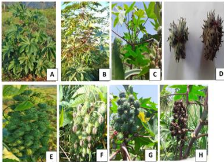
Fig 1. A, B y C) Plantas de higuera de dos variedades Criollas; D) Frutos de tres lóbulos; E y F) Frutos de las plantas correspondientes a las variedades Criollas que se muestran; G y H) Frutos en diferentes momentos de maduración.

Figura 1. A, B y C) Plantas de higuera de dos variedades Criollas; D) Frutos de tres lóbulos; E y F) Frutos de las plantas correspondientes a las variedades Criollas que se muestran; G y H) Frutos en diferentes momentos de maduración.